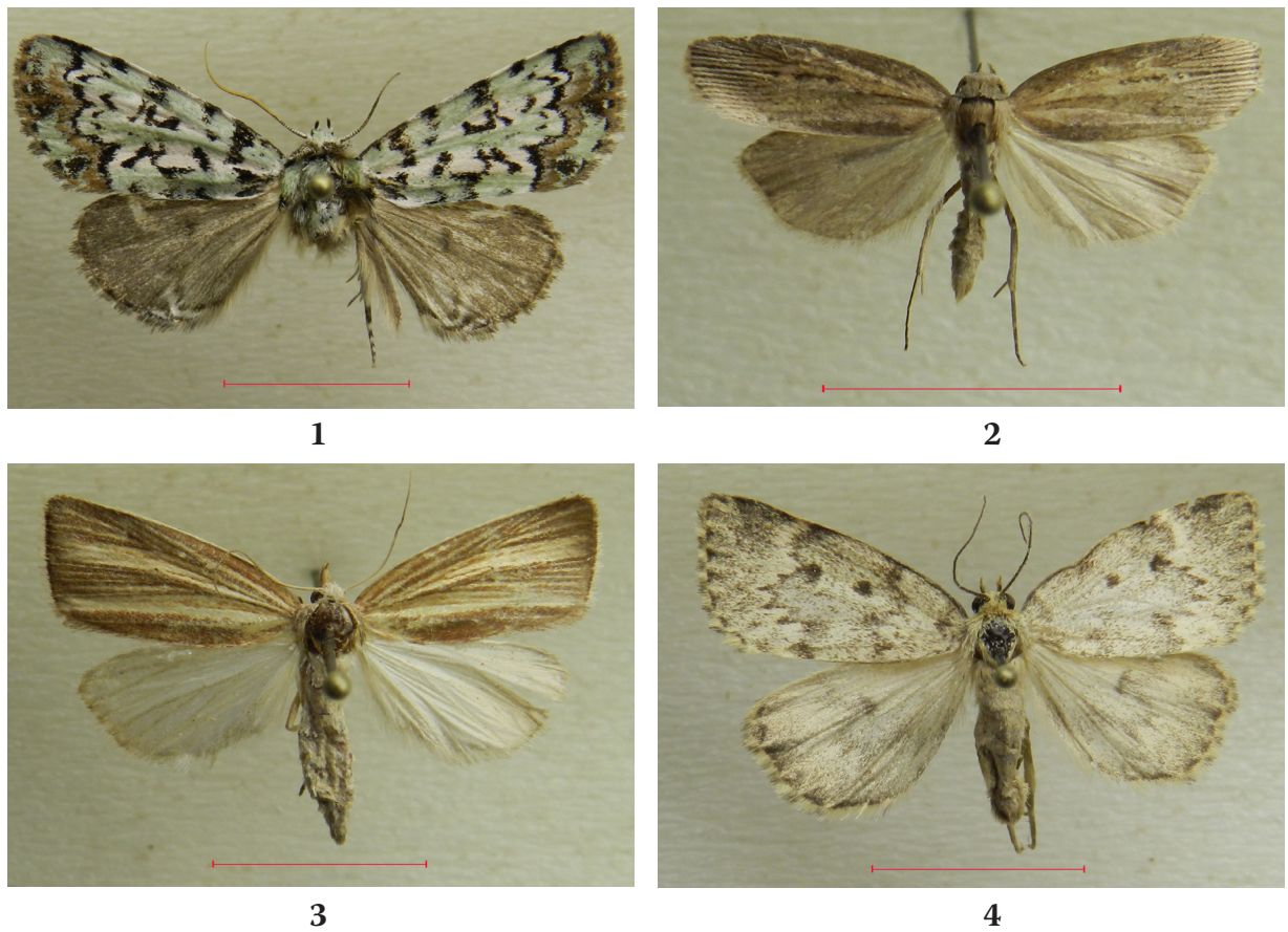
Рис. 2. Бабочки, Аньюйский национальный парк: 1 — Moma tsushimana Sugi, 1982 (Noctuidae), ♂, кордон Богбасу, 27–28 июня 2018; 2 — Chilodes pacifica Sugi, 1982 (Noctuidae), ♂, протока Бира, 23–24 июля 2018; 3 — Doerriessa striata Staudinger, 1900 (Noctuidae), ♀, кордон Нило, 24–25 июля 2018; 4 — Xestia kurentzovi (Kononenko, 1984), ♂, спуск к кордону Богбасу, опушка леса и небольшой каменистый развал, 2–3 июля 2019