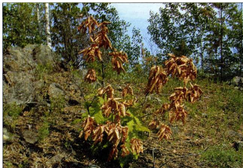
Молодая дубовая поросль после весеннего пожара.

Из-за приграничного положения роща до последнего времени крайне редко посещалась биологами. Даже объявление ее региональным памятником природы в 1983 г. не обошлось без курьеза. Определение условий произрастания дубов велось