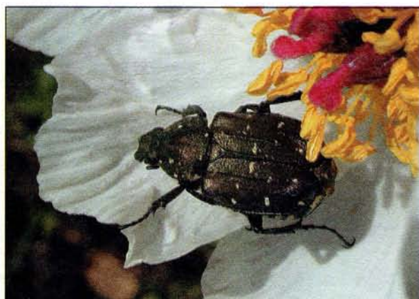
Восковик-гноримус на цветке пиона.