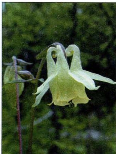
Водосбор острочашелистиковый (справа — белоцветковая форма).