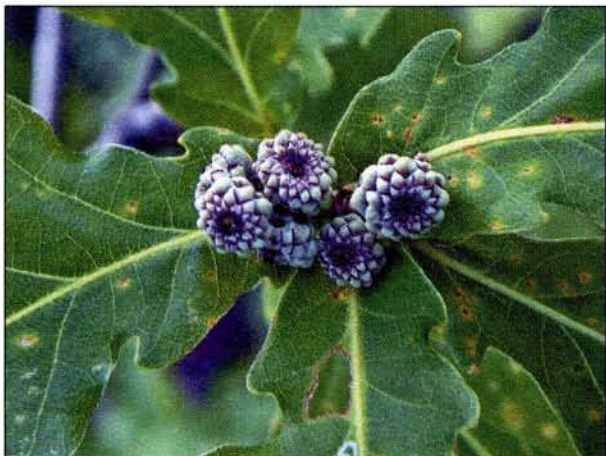
Ветка монгольского дуба в эталонной роще. Здесь и далее фото О.В.Корсуна